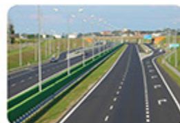
6 Lanes Highway