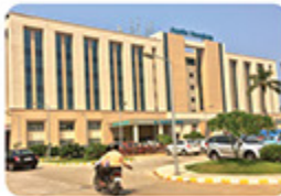
Health City, Arilova