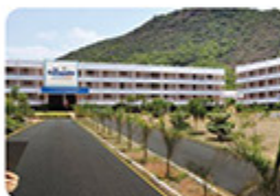
Sai Ganapathi Engg.College